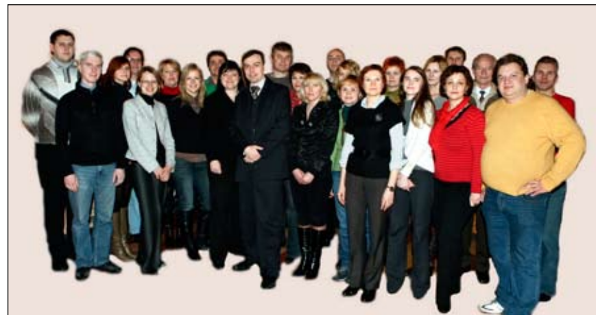
UADBB „RDD“ kolektyvas. 2010 m.

Bendrovė pradėjo veiklą 2003 10 21 UAB „RDD“ pavadinimu. 2004 10 14, gavus draudimo brokerių įmonės veiklos licenciją, įmonės statusas pakeistas į UADBB „RDD“.