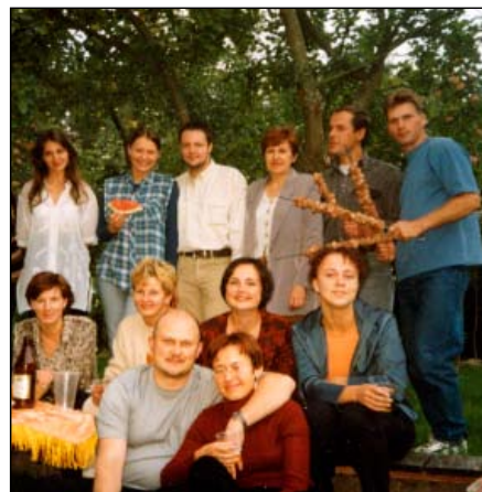
„Lietuvos draudimo“ Vilniaus filialo ir „Finalo“ darbuotojai iškylauja, 1999 m.

Draudimo brokeriai ne vien tik dirba... Jie iškylauja, švenčia, sportuoja, bendrauja, mokosi, leidžia laiką su šeima.