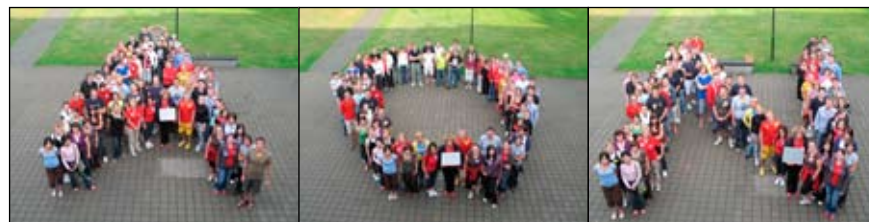
UADBB „Aon Lietuva“ kartu su „Aon“ įmonių Latvijoje ir Estijoje darbuotojais. 2009 m. rugsėjis

Turizmas, muzika, Lietuvos istorija ir etninė kultūra.