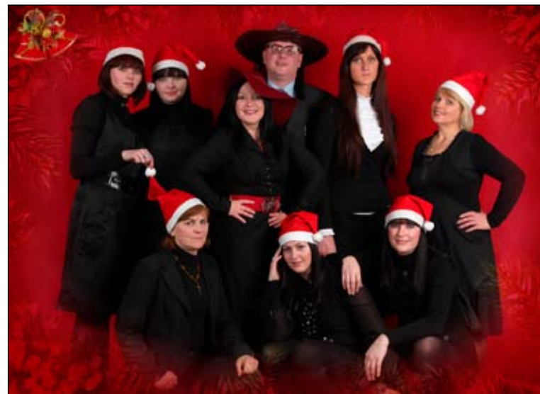
„Olvirgos“ kolektyvas švenčia 2010 Naujuosius metus.