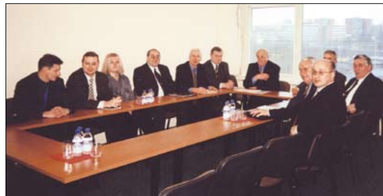
LDA ir LDBA prezidentų bendras posėdis, 2000 m.