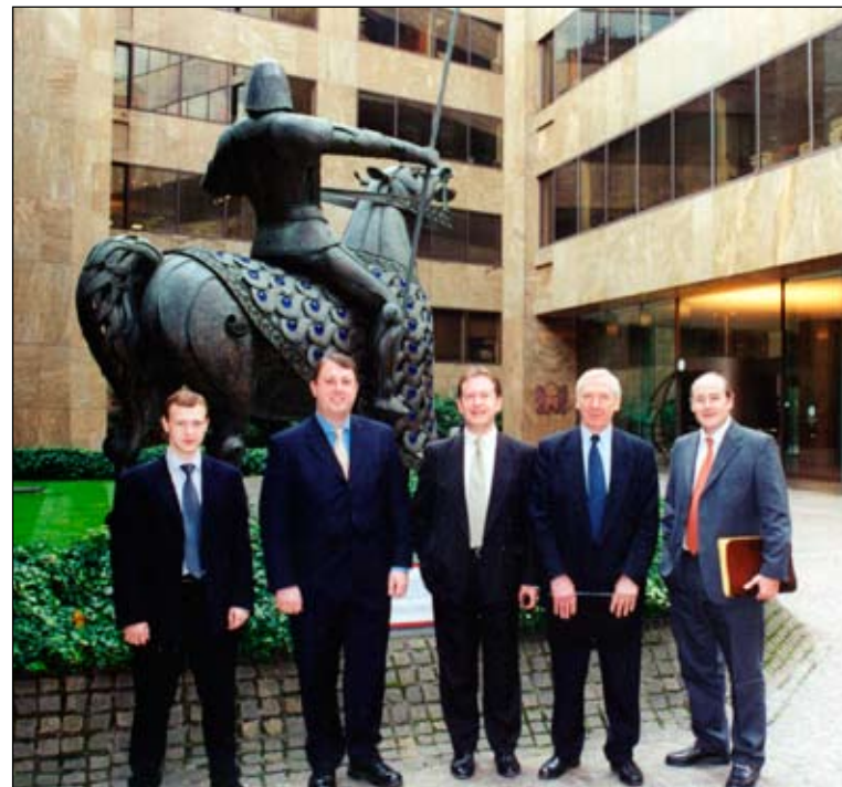
Autorius (antras iš dešinės) stažiuotasi pas savo kolegas „Aon Limited“ Londone, 2001 m.